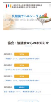
ホームページ(スマートフォン画面)