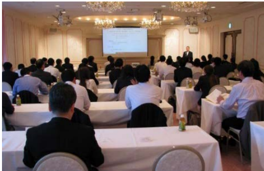
生産技術・衛生講習会

ISOで認められた測定培地及び測定法を掲載した「ビフィズス菌使用発酵乳、乳酸菌飲料のガイドライン」の普及・定着を図り、検査担当者の検査技術の向上を目的として「微生物検査研修会」を開催しています。