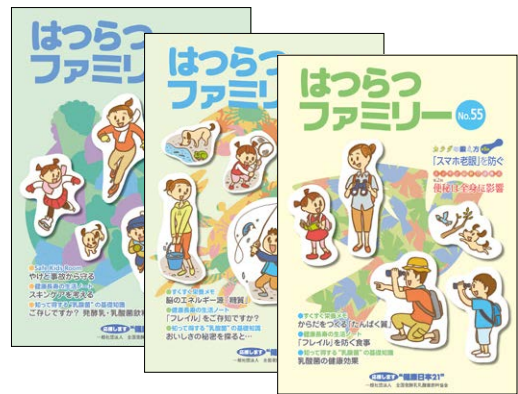
「はつらつファミリー」