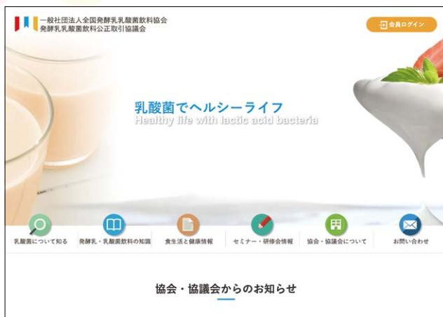
ホームページ(パソコン画面)

①協会・協議会の活動状況 ②発酵乳・乳酸菌飲料の知識 ③乳酸菌の科学性などについて幅広く情報を提供しています。また当ホームページは、スマートフォンやタブレット閲覧でも見やすいように構成しています。