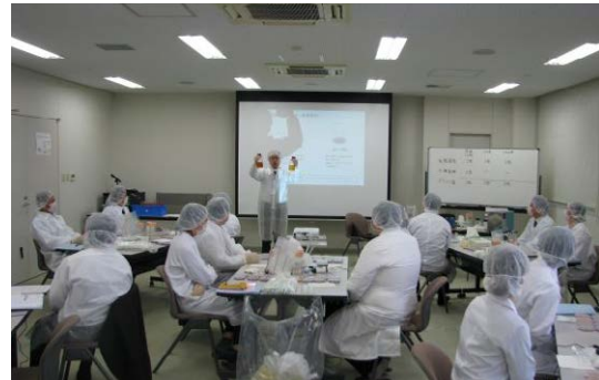
微生物検査研修会