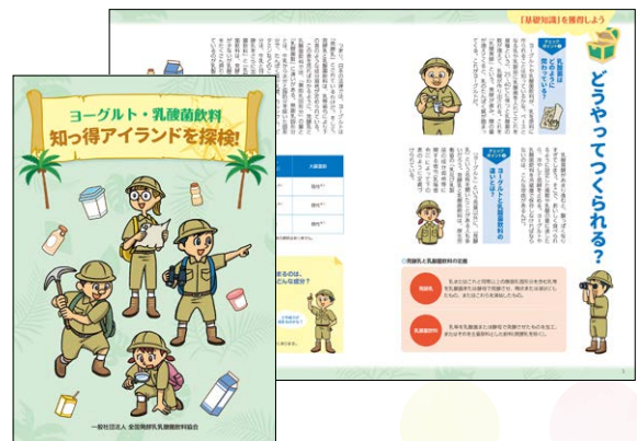
「ヨーグルト・乳酸菌飲料 知っ得アイランドを探検!」